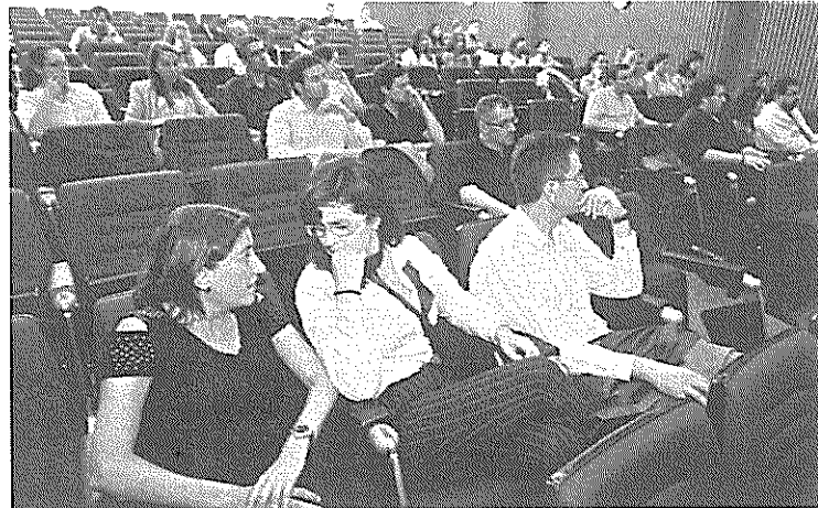
Asistentes a la jornada de APD y Xuventude «El Camino del liderazgo»